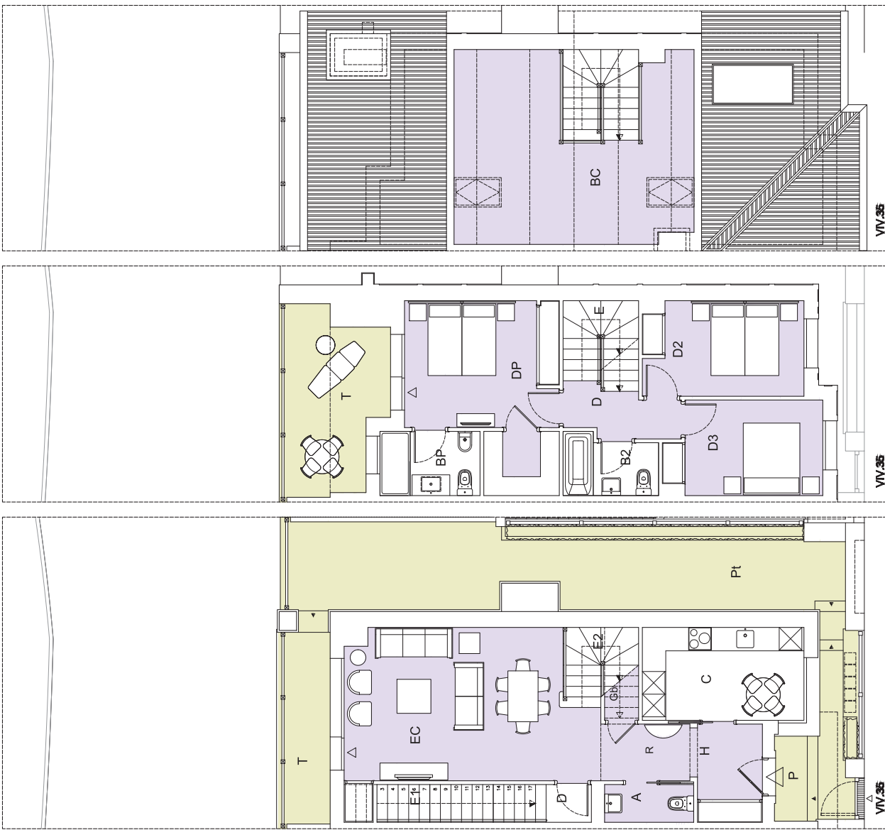
Cuadro de superficies